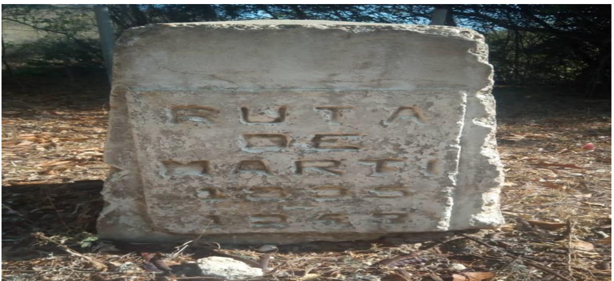
MONUMENTO EL YAREY