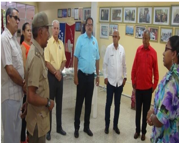
Taller Regional de la zona oriental del Proyecto Nacional Guerra de Liberación.