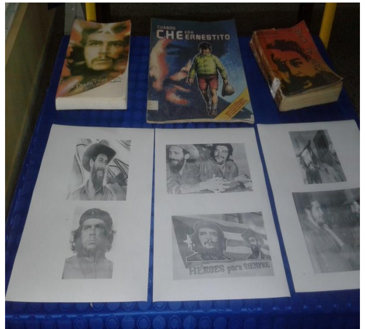
Exposición. "El guerrillero Ernesto."