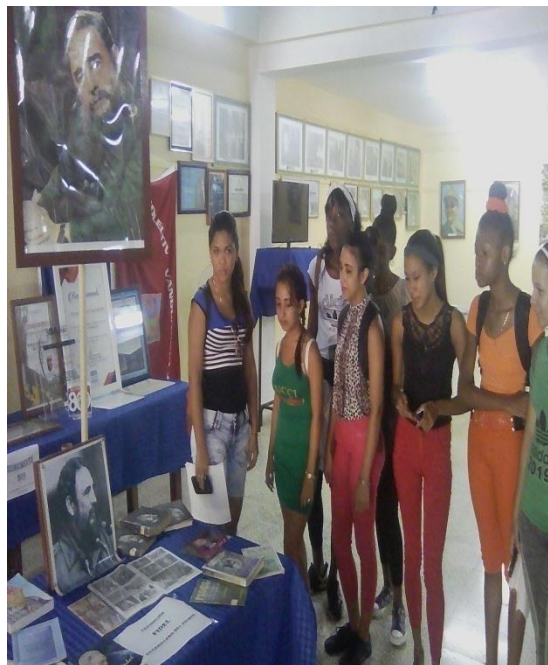
Expo. “Fidel, soldado de las ideas.”

Anexo 9. Actividades desarrolladas desde la Sala de historia “Raúl Gómez García” de la Universidad de Guantánamo.