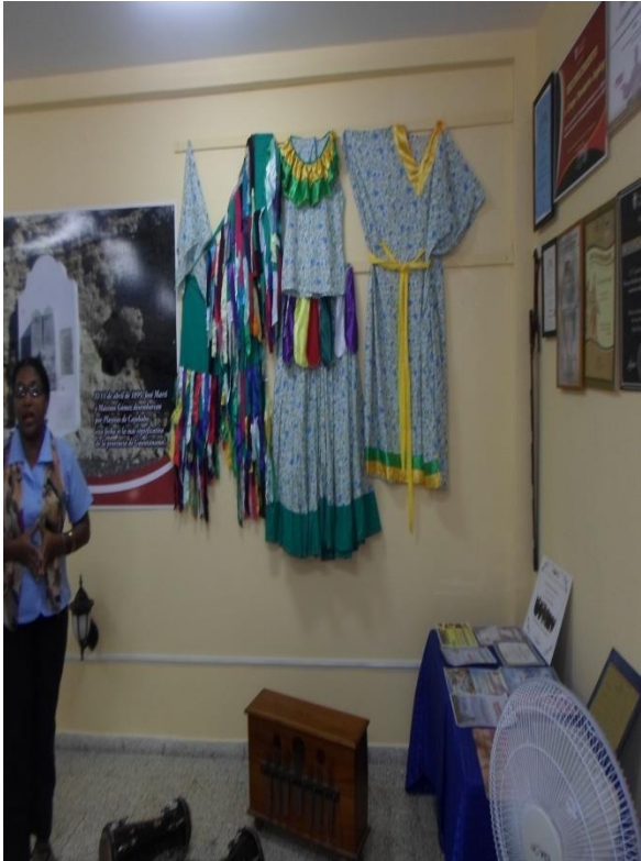
Expo. "Jagüey 44 años de folclor"