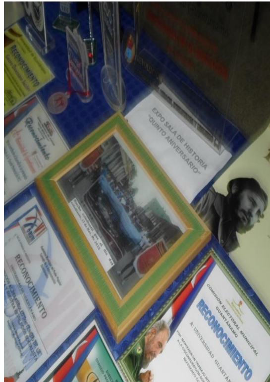
Expo. Sala de Historia "Raúl Gómez García."