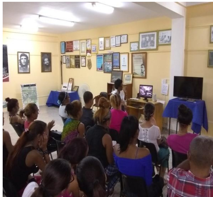
Conferencia. “El joven Fidel.”