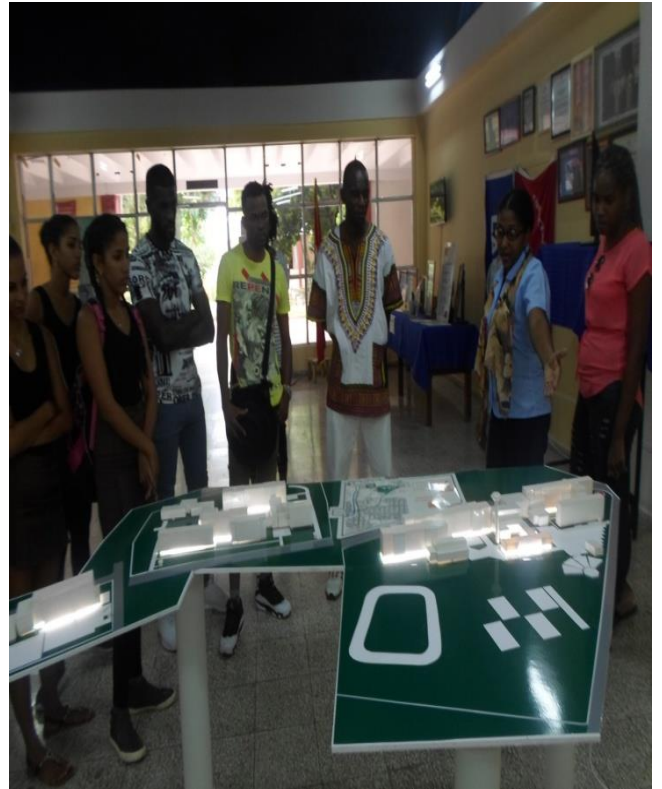
Visita a la sala de historia del conjunto Jagüey