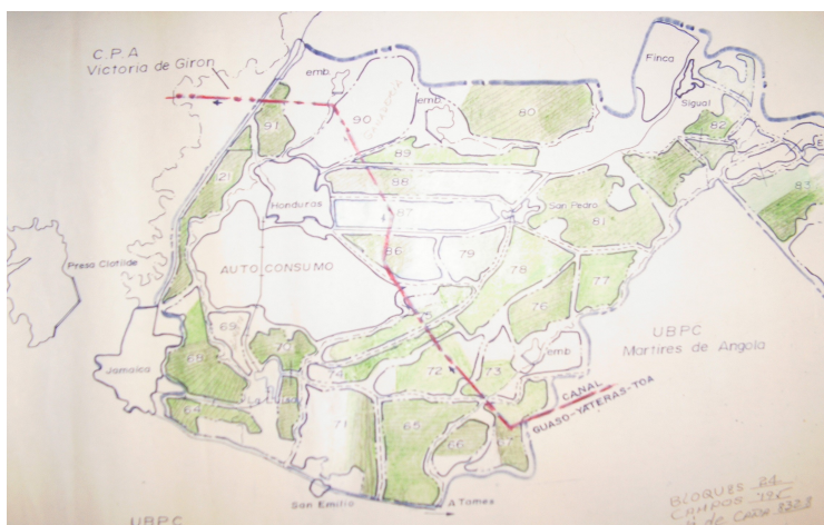
Mapa 1.- Ubicación geográfica del área de estudio.

El presente trabajo se realizó en el huerto de autoconsumo "La Habichuela" de la antigua Granja Agropecuaria de Honduras en el periodo de enero del 2008 hasta noviembre del 2009. El área seleccionada como sitio experimental está ubicada al este del antiguo Central Azucarero. El área tiene una extensión aproximada de 2 ha y una pendiente entre 0.5 -1 % donde con gran frecuencia las aguas de escorrentía producto de las lluvias son conducidas. El Consejo Popular de Honduras abarca una extensión de 17,7 Km.